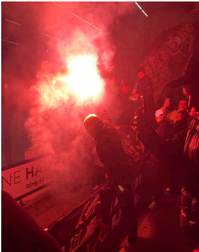
Fotograf: Lucas John Hansen - vinder af skolekonkurrencen Fang din by 2023