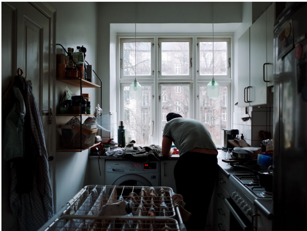
Fotograf: Natasha Lhea Narvaez Nielsen, vinder 1. plads åbne konkurrence 2023