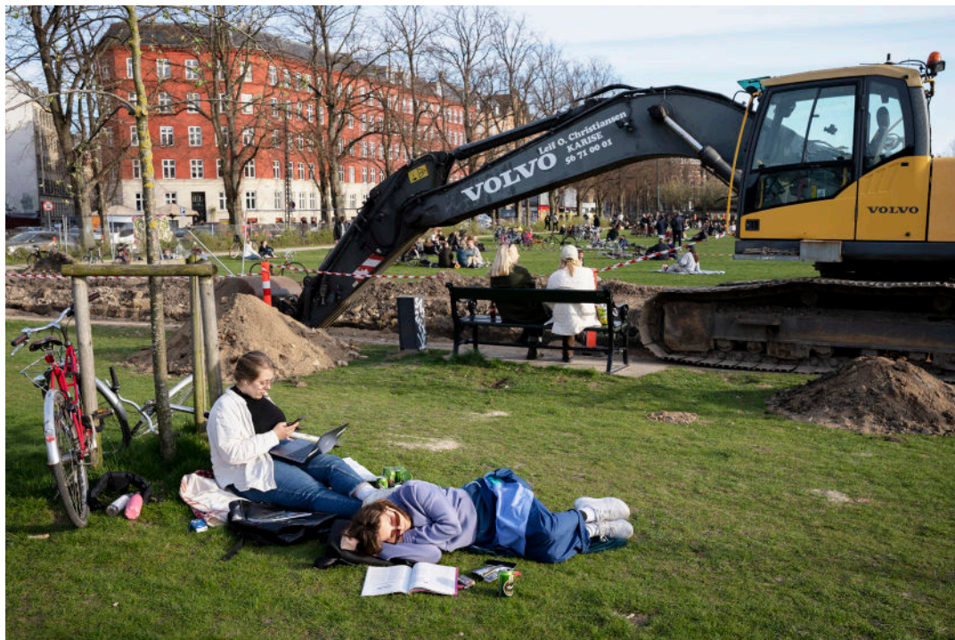
Fotograf: Asger Korsgaard, vinder af 2. plads åbne konkurrence 2023